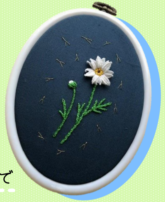
※作品完成イメージ