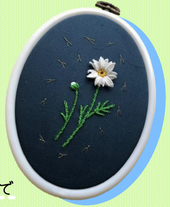
※作品完成イメージ