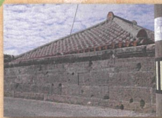
石壁に刻まれた弾痕(南城市)