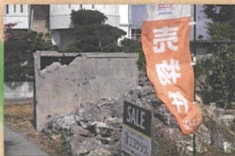
売りに出された戦争遺跡(糸満市)