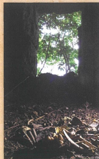
古墓に残された遺骨と遺品(糸満市)